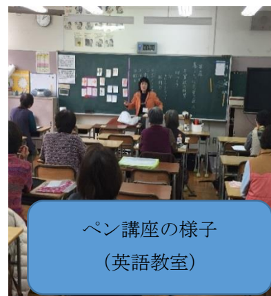
ペン講座の様子 (英語教室)

14時からペン講座が始まり、それに併せて講座を受講される18名の地域の方々ที่มา校されました。その時間、学校は掃除活動で、生徒達は来校された方々に大きな声で挨拶をしていました。第1回目の講座の時は、授業の様子を参観して頂きました。地域の方々から見守られているという生徒達の意識が高まったと感じます。